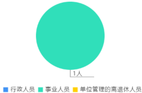
人员情况构成饼图